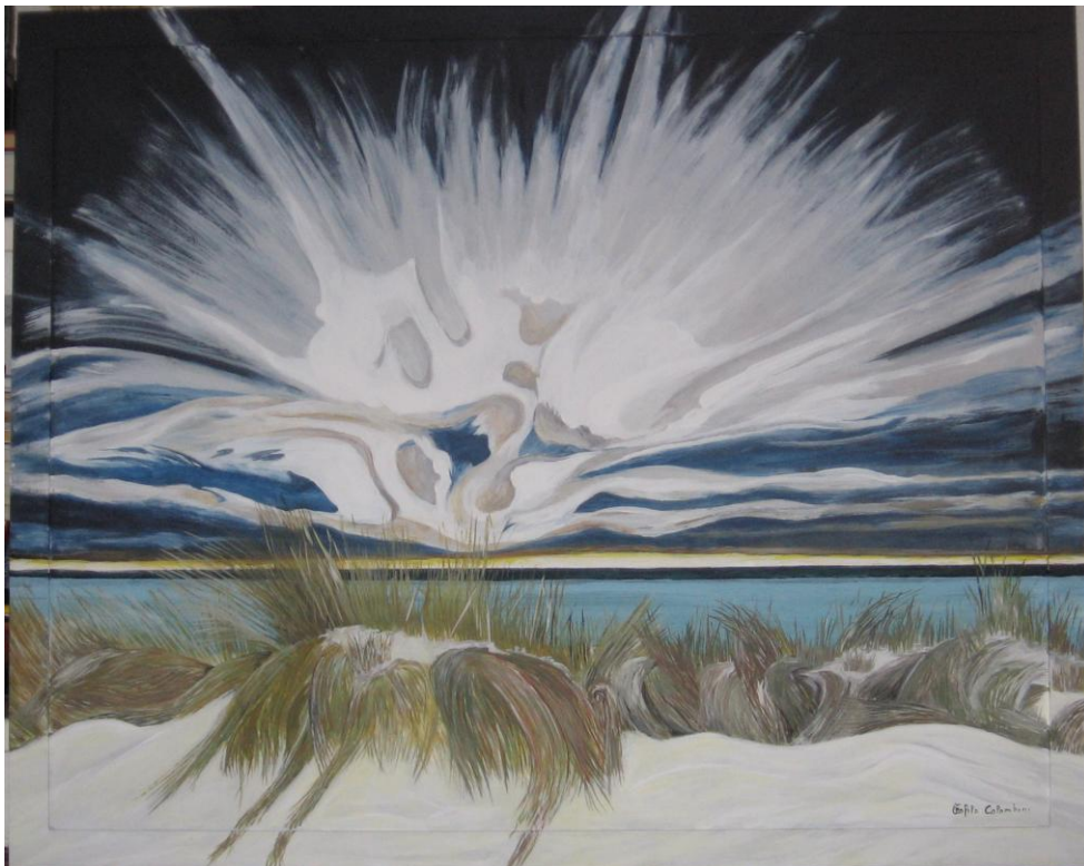
Opera di Teofilo Colombini