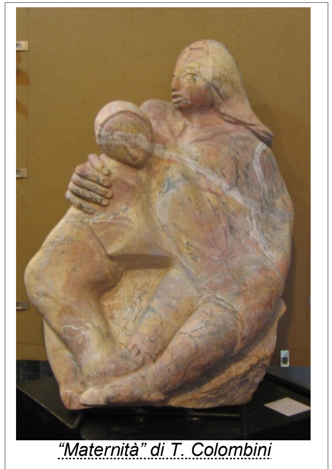
“Maternità” di T. Colombini