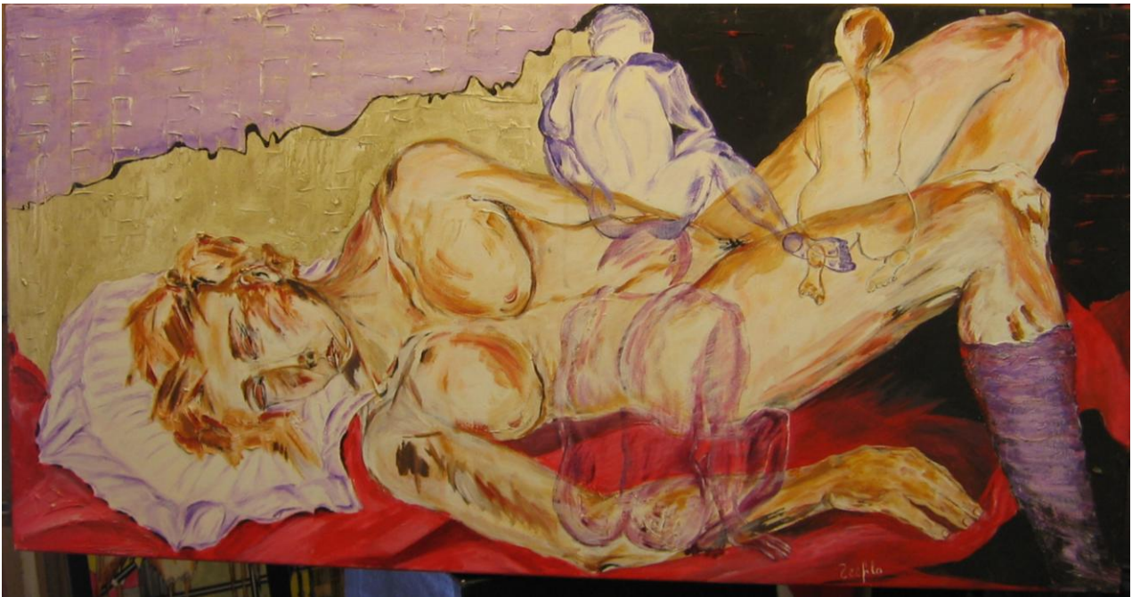
“Pensieri di Donna” di T. Colombini