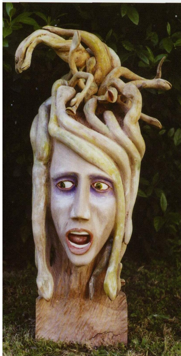
"Gorgone" Scultura ligure di Teofilo Colombini